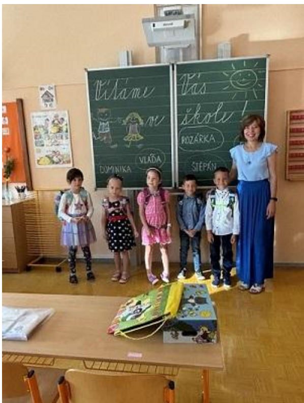
Naši noví prvňáčci