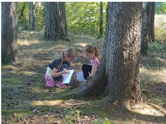
Učíme se v lese