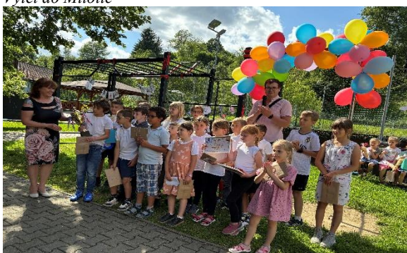
Zahradní slavnost – předávání vítězného poháru