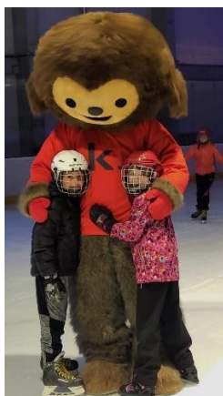
Bruslení na Kapce