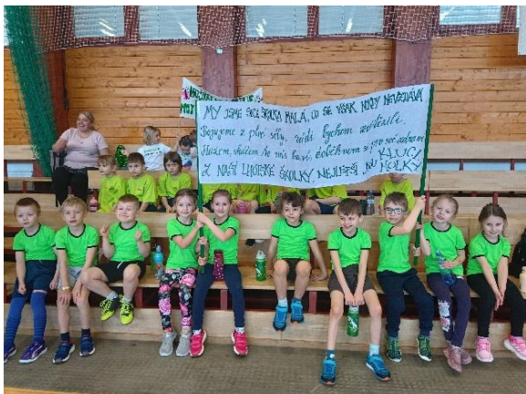
Atletický pětiboj MŠ