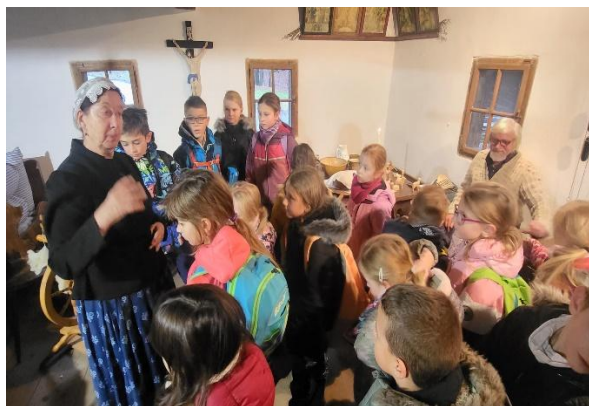
Vánoce na dědině – Rožnov pod Radhoštěm