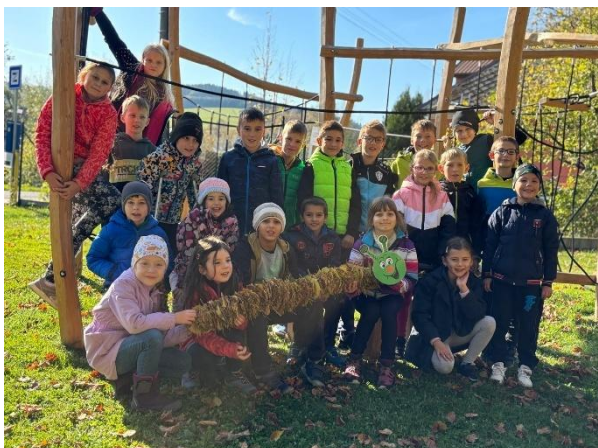
Podzimní hry na zahradě žáci školy