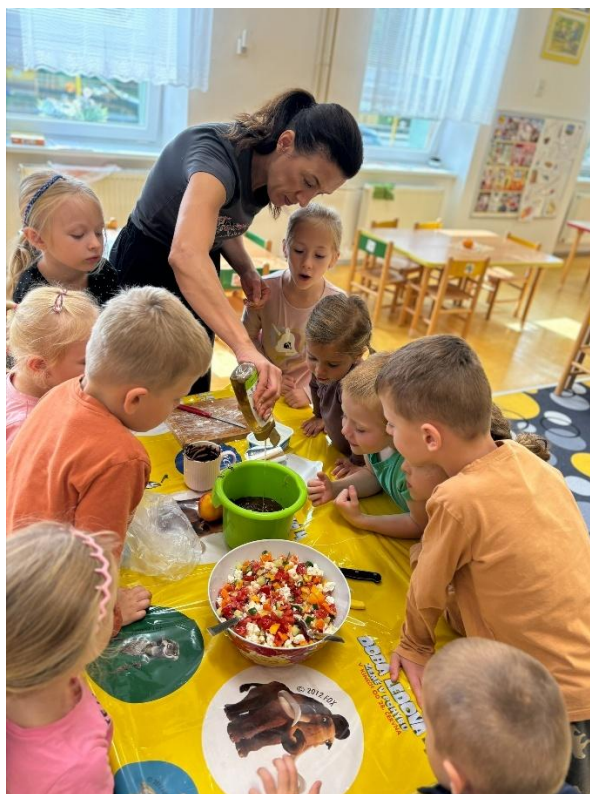
Týden zdravé výživy