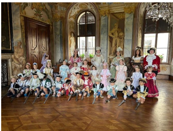
Výlet do Milotic