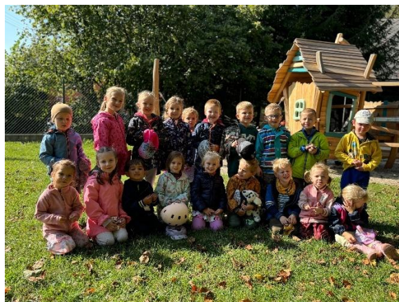
Děti mateřské školy